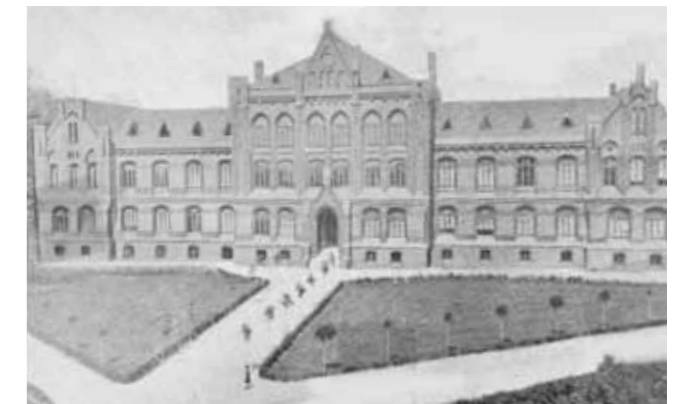
Das Hauptgebäude im Knooper Weg nach seiner Fertigstellung, 1877