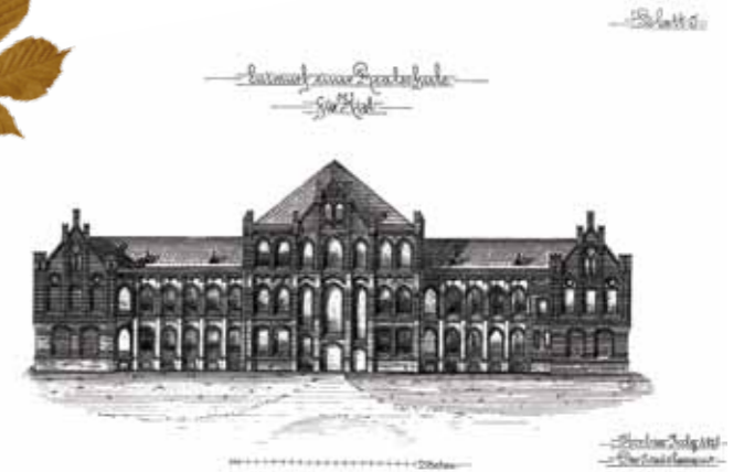
Entwurf der Hofansicht