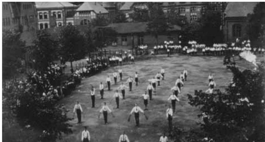
Gemeinschaftliche Übung auf dem Schulhof, 1918