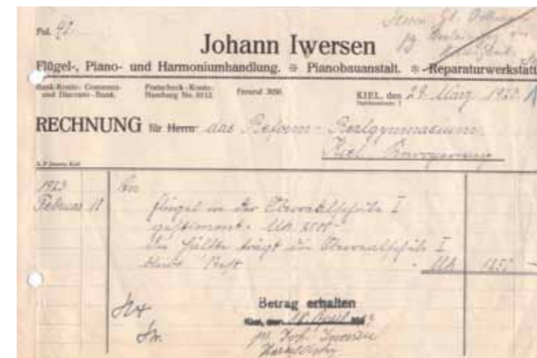
Teure Rechnung für das Stimmen eines Flügels, 1923