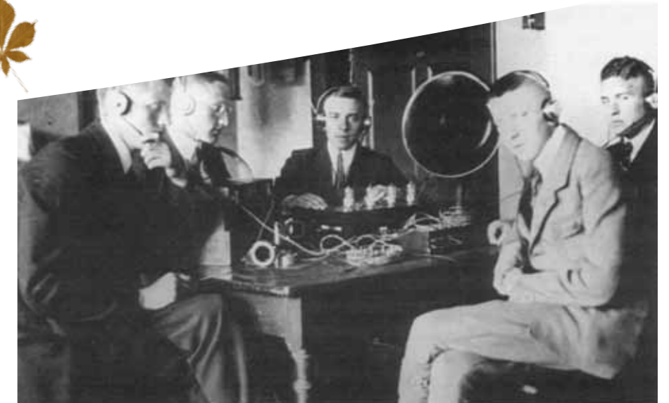
Oberprimaner des Reform-Realgymnasiums mit ihrem gemeinsam gebauten Radio-Röhrengerät, 1925