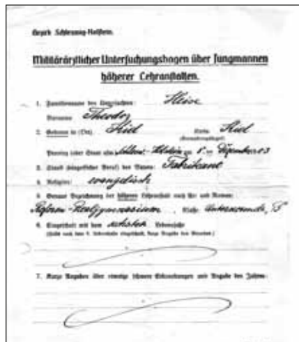
Militärischer Untersuchungsbogen, 1918