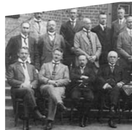
Das Kollegium (Ausschnitt) 1925

1926 Angliederung eines Zuges „Deutsche Oberschule“