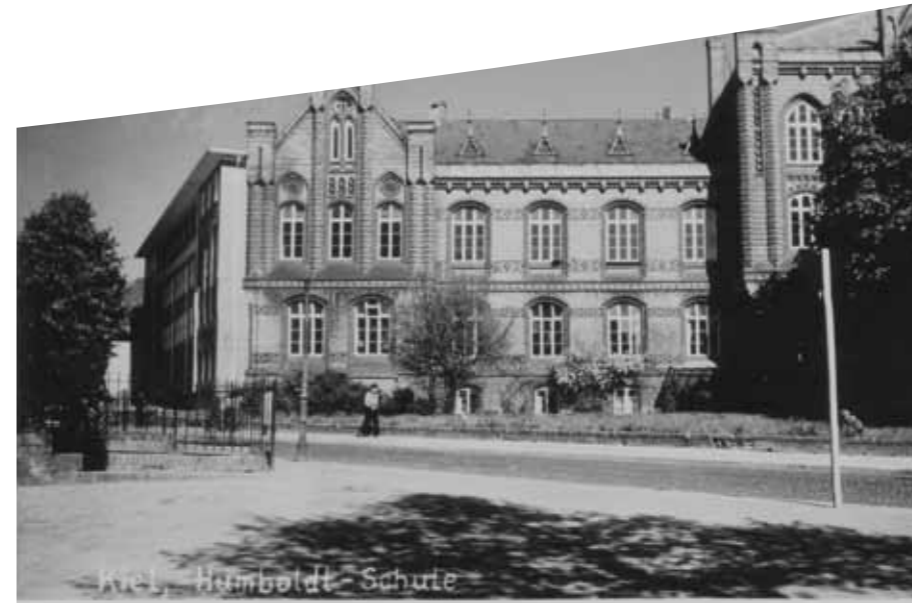
Schule nach dem Wiederaufbau des Flügels an der Klopstockstraße