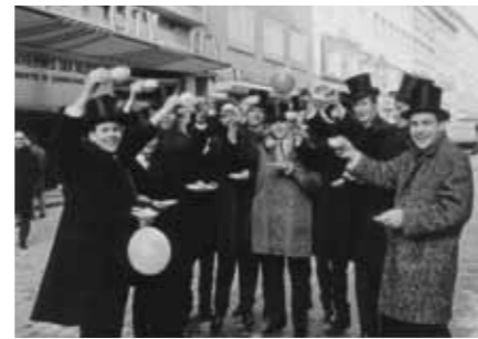
Abiturienten auf der Holstenstraße um 1950