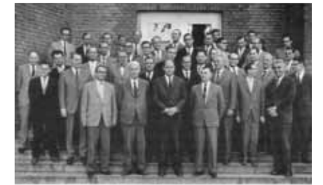
Das Kollegium 1961