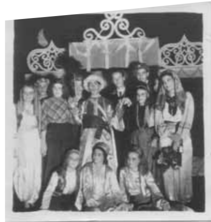
Schultheater um 1950 - Opernaufführung „Auch eine Entführung“ von Krützfeldt