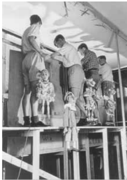
Marionettenbühne der 50er Jahre