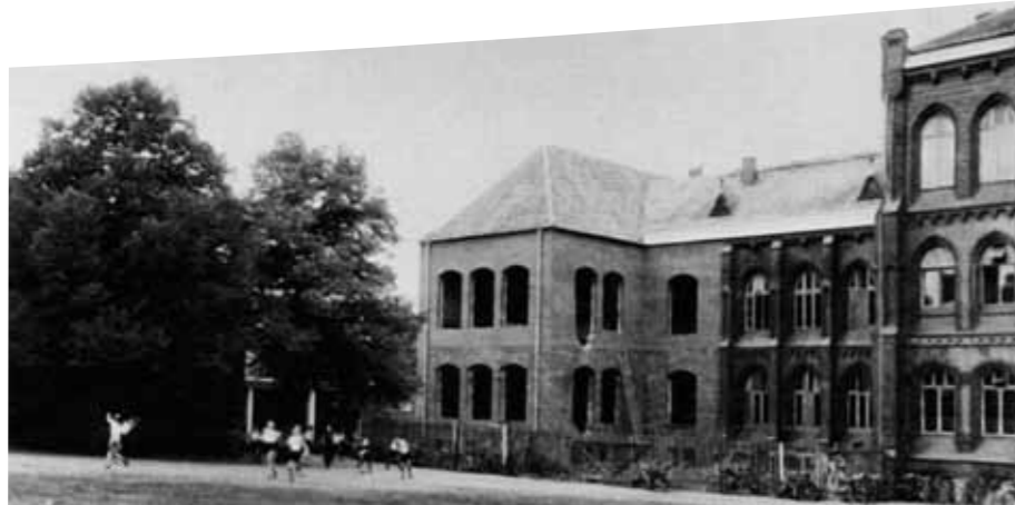
Wiederaufbau des nördlichen Altbauflügels 1952