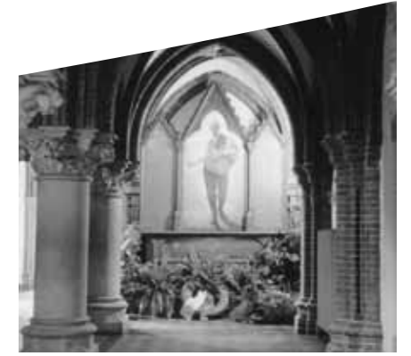
Ehrentafel in der Vorhalle in den 50er Jahren