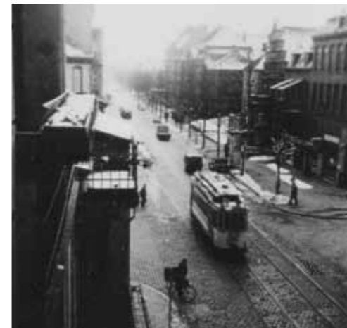
Knooper Weg / Ecke Fleethörn, 1951